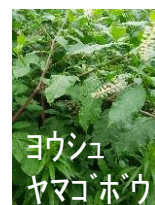
ヨウシュ ヤマゴボウ