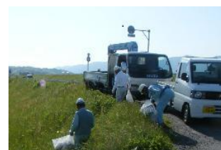
異物等の除去状況(例)