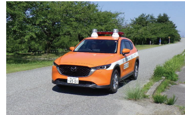
河川パトロールカー

黒部川の河川巡視を行う河川パトロールカーより、河川利用者に対して音声でクマ出没注意の呼びかけを行っています。