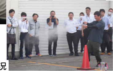
クマ対策講習会実施状況