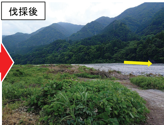
伐採状況(黒部市宇奈月町音沢地先)