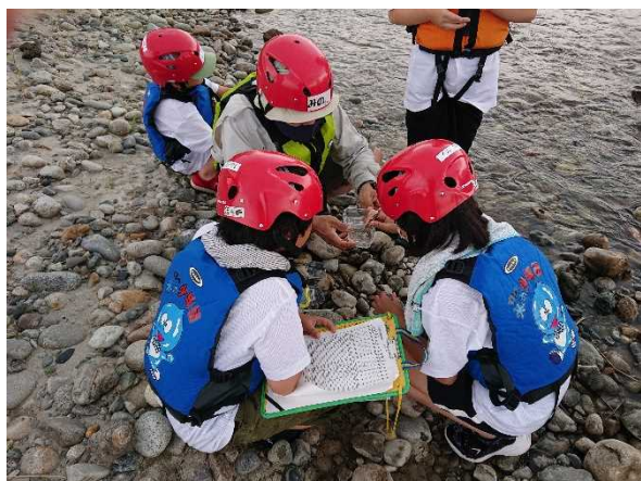
令和4年度 下流部調査