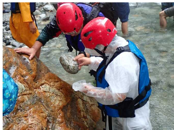
令和4年度 上流部調査