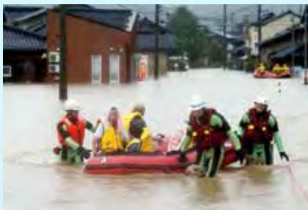
石川県小松市消防団 ボートによる救助活動を実施 (令和4年8月4日: 中海地区)