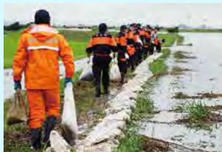
宮城県涌谷町消防団 積み土のう工、月の輪工を実施 (令和4年7月16日~17日: 出来川左岸)