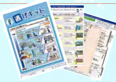
検討ツール「逃げキット」

マイ・タイムラインの検討は、洪水ハザードマップ等を用いて居住地などの自ら関係する水害リスクや入手する防災情報を 知る ところから始まり、避難行動に向けた課題に 気づく ことを促し、どのように行動するか 考える 場面を創出することが重要です。