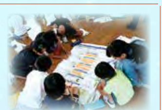
マイ・タイムライン作成・検討の様子