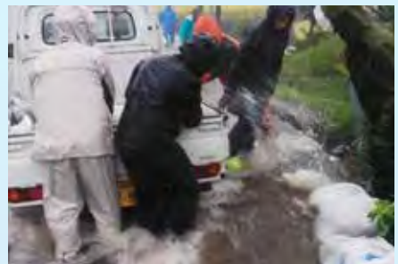
大分県由布市消防団 積み土のう工を実施 (令和4年9月17日~22日: 光永宮川付近)