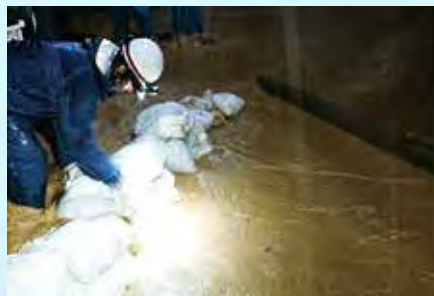
静岡県島田市消防団 積み土のう工を実施 (令和4年9月23日~24日: 大草の池周辺)