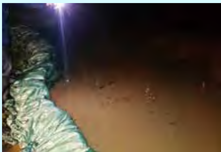
青森県鶴田町消防団 積み土のう工を実施 (令和4年8月9日~12日: 岩木川左岸)