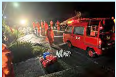
新潟県村上市消防団 排水活動を実施 (令和4年8月3日~4日: 高根川高根地先)