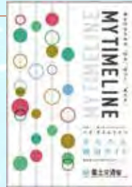
かんたん検討ガイド