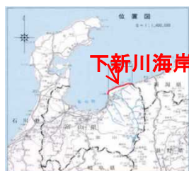
平成20年2月の高波(寄り回り波)災害

下新川海岸水防連絡会は、下新川海岸沿岸における近年で最も甚大な被害をもたらした平成20年2月の高波(寄り回り波)を想定した机上演習を行います。