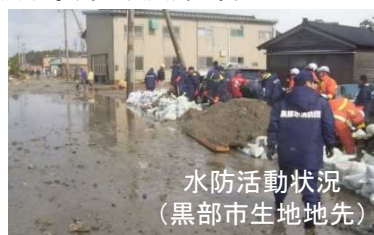
水防活動状況 (黒部市生地地先)