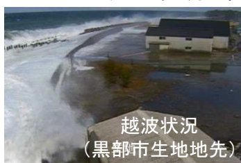
越波状況 (黒部市生地地先)