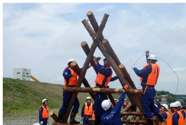
(参考) 「立蛇籠工」及び「川倉工」の訓練の様子