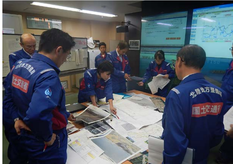
令和元年度演習時の様子(黒部河川事務所内)