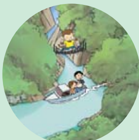
野猿移動用吊り橋見学 (遊覧船体験乗船)