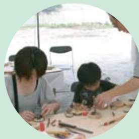
森のクラフト教室