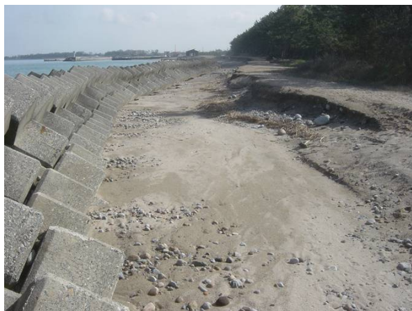
NO, 13より東方向 養浜侵食状況