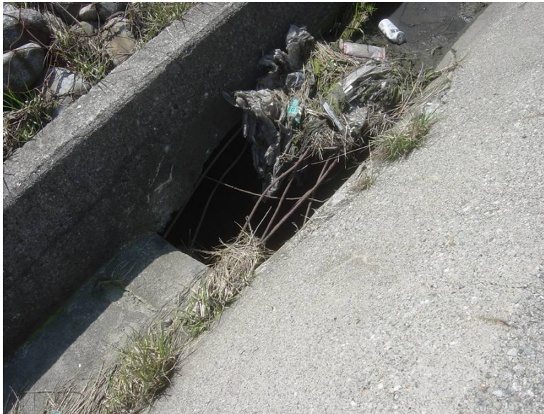
NO. 140+20 直立堤排水路の安全網破損