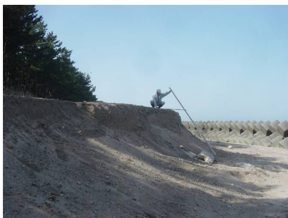
NO, 15付近 養浜侵食状況