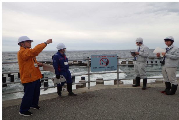
黒部市生地芦崎地先