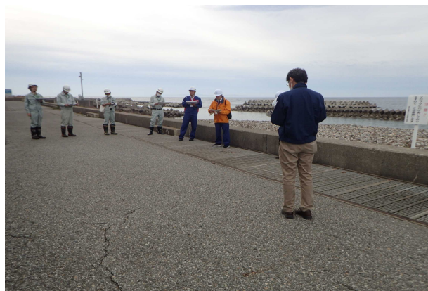
入善町下飯野地先