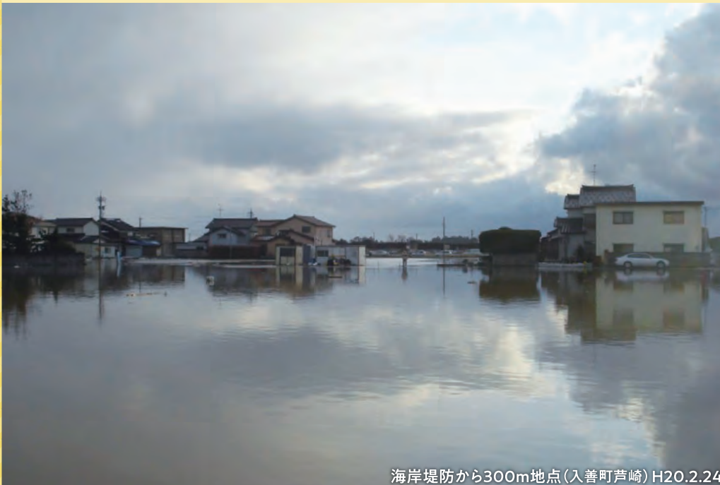
海岸堤防から300m地点(入善町芦崎) H20.2.24