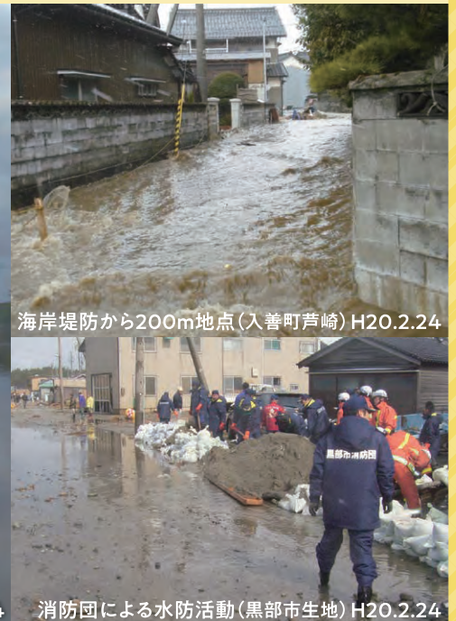
海岸堤防から200m地点(入善町芦崎) H20.2.24