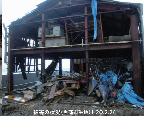
被害の状況(黒部市生地) H20.2.24