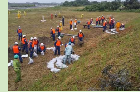
水防工法研修会 (水防団等138名) (R5.6.11)