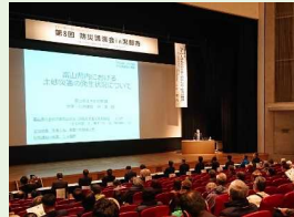
防災講演会 In黒部市 (R5.11.18)