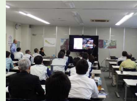
流量観測研修会 (R5.10.24等)