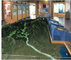
宇奈月ダム資料館（大夢来館）

○宇奈月ダム資料館に河川・砂防・ダム・海岸の流域の状況をわかりやすく伝えるための資料を展示(国)