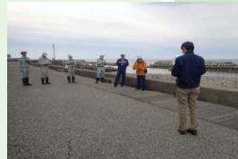
高波に備えた現地視察会 (R5.11.6)