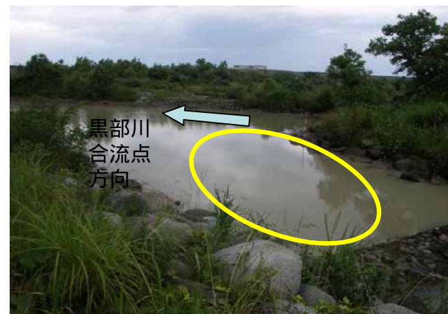
7/2 07:19 自然流下時には瀬切れが発生する