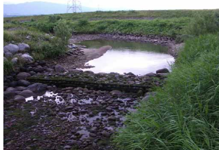
7/2 07:22 瀬切れにより連続性がなくなった水路