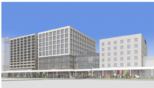
米百俵プレイス（仮称）