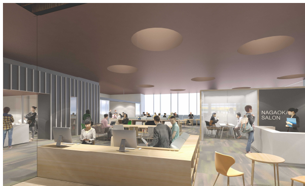
産学連携情報交流センター（仮称）整備事業