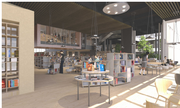
まちなか図書館（仮称）整備事業