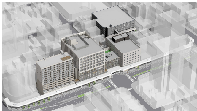
米百俵プレイス（仮称）