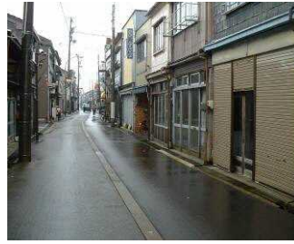
▲ シャッター通りとなっている商店街

人口減少、高齢化による中心市街地の衰退や空洞化が進んでおり、市民生活の安定化、経済活力の確保等のため、中心市街地の活性化が喫緊の課題である。