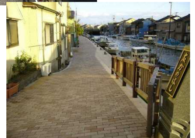
▲ 「日本のベニス」内川沿いの遊歩道