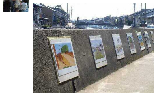
獅子舞競演会と壁画設置状況