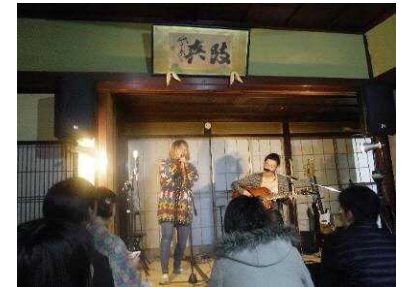
▲旧北陸街道沿道での空き家・空き店舗活用事業（古民家ライブ）