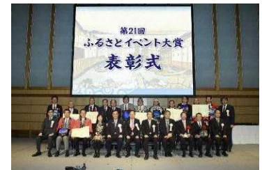
▲第21回ふるさとイベント大賞で大賞（内閣総理大臣賞）を受賞した福岡町つくりもんまつり