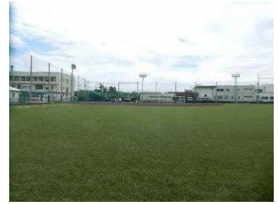
▲スポーツ広場等の文教ゾーンが整備された福岡中央地区

住民が景観まちづくりを進める団体を結成（H21.5～）し、市が旧北陸街道福岡地区を景観形成重点地区に指定し、（H21.11～）「高岡市歴史まちづくり計画」（H23.3）の中で維持及び向上すべき歴史的風致に位置づけるなど、伝統的町並み景観の保全に取り組んでいる。