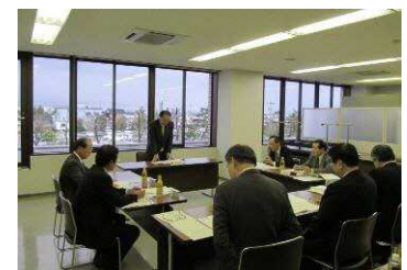
▲事後評価委員会の様子