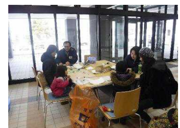
▲エコまちづくりイベントで賑わう地域交流センター