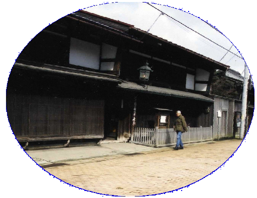
▲ 国指定重要文化財 北前船回船問屋森家

また、伝統的建物の修景基準を作成し、それに合わせた改修実施者に補助をし、歴史的街並みの保存・再生を図る。