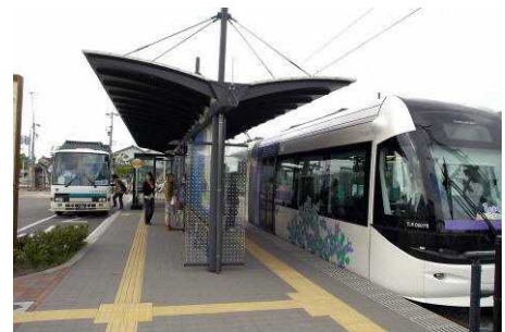
▲ 富山ライトレールとフィーダーバスの結節（岩瀬浜駅）

富山港線の岩瀬浜駅と蓮町駅を基点とし、東西方向にフィーダーバスを運行することにより鉄道の支線の役割を担い、富山港線の利用者増加と公共交通不便地域の解消を図る。