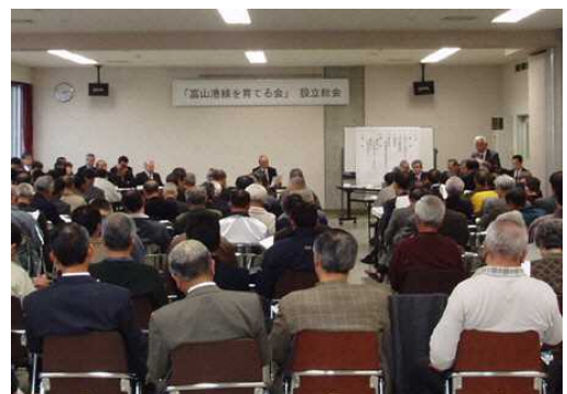
▲ 「富山港線を育てる会」の様子

各校区の自治振興会が中心となった「富山港線を育てる会」という組織が結成されており、富山港線の利用促進や沿線地域のまちづくりについて意見を頂いているところで、今後ともこの会を中心としてまちづくりのあり方を協議していく。