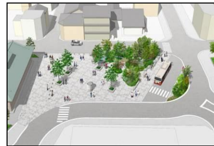
菊の湯広場イメージ図