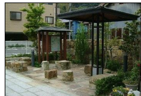
ポケットパークイメージ