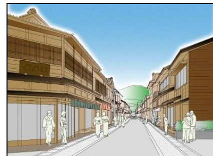
散策路イメージ図