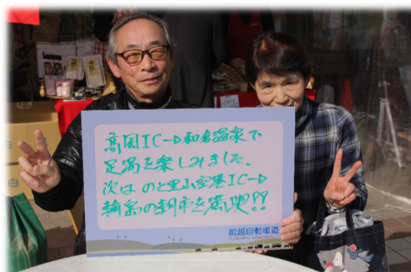
上市町にお住まいのお二人

高岡ICから和倉温泉で足湯を楽しみました。次はのと里山空港ICから輪島の朝市を満喫したいです。