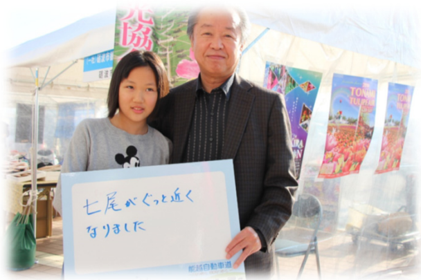
ご家族でお越しのお二人

平成30年11月25日（日）に開催された『第4回能越道フェスティバル』でインタビューしました！