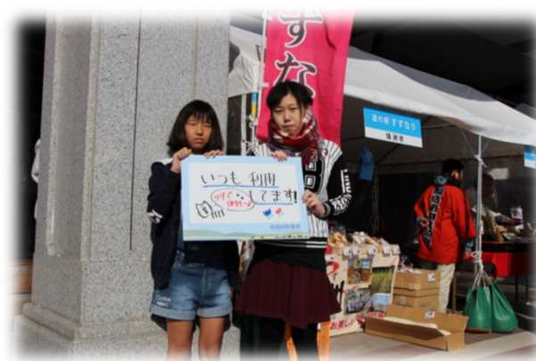
高岡市にお住まいのお二人