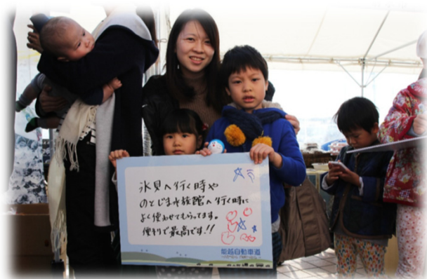
高岡市にお住まいのご家族