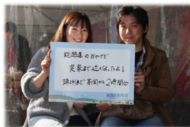
高岡市にお住まいのお二人

高岡ICから和倉温泉で足湯を楽しみました。次はのと里山空港ICから輪島の朝市を満喫したいです。