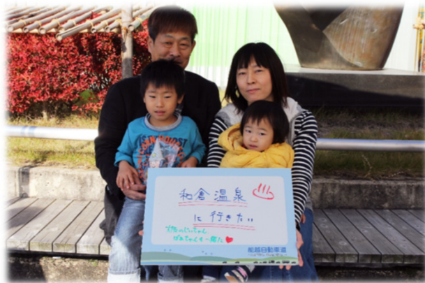
小矢部市にお住まいのご家族