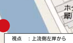
視点 : 上流側左岸から