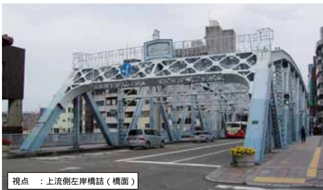
視点 : 上流側左岸橋詰(橋面)

本橋は主に犀川周辺を中心に視点場が存在します。河川、遠方の山並みをはじめとする自然景観構成要素、建築をはじめとする人工的な景観構成要素の現在の状況は概ね以下のとおりです。