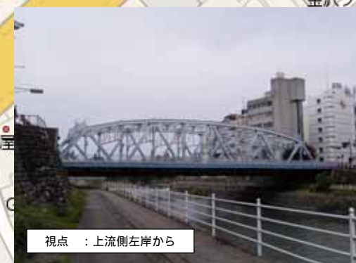
視点 : 上流側左岸から