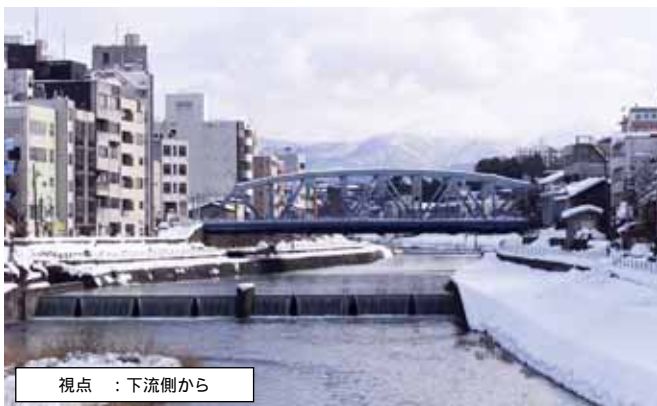
視点 : 下流側から

空気の澄んだ日には医王山や戸室山をはじめとする加賀の山並みと曲弦の柔らかさが美しく調和します。