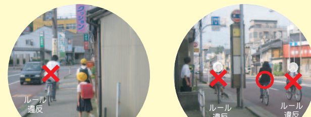
歩道上で自転車を怖がる小学生