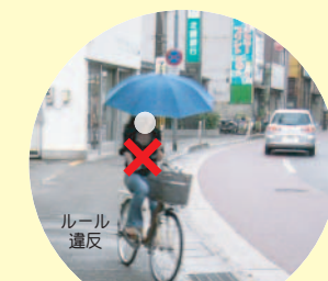
傘をさしながら歩道を逆走する自転車