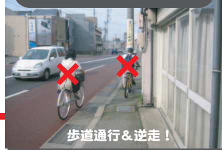
歩道通行 & 逆走！