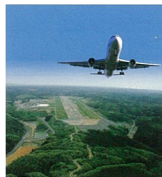
空の玄関口 のと里山空港