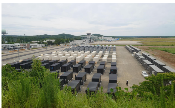
防災道の駅「のと里山空港」の使用状況