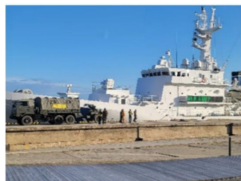
マリントウン岸壁からの給水支援(輪島港)