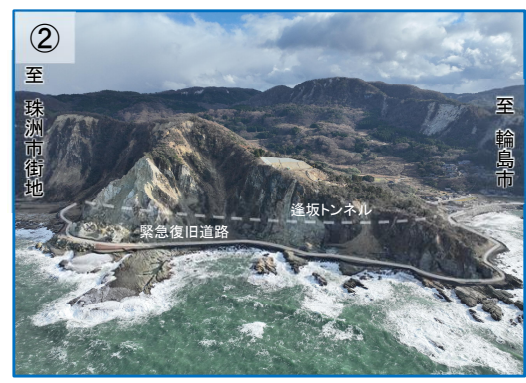
待避所設置箇所通行イメージ