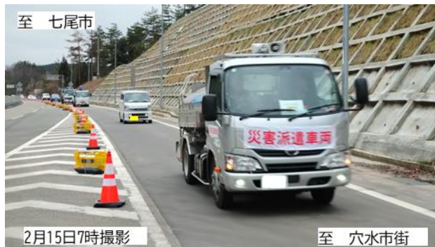
■写真② のと里山海道越の原IC付近■