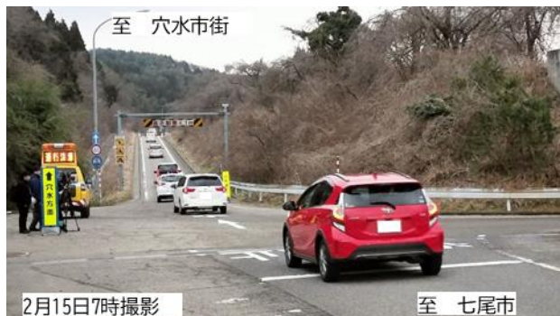
■写真① のと里山海道横田IC付近■