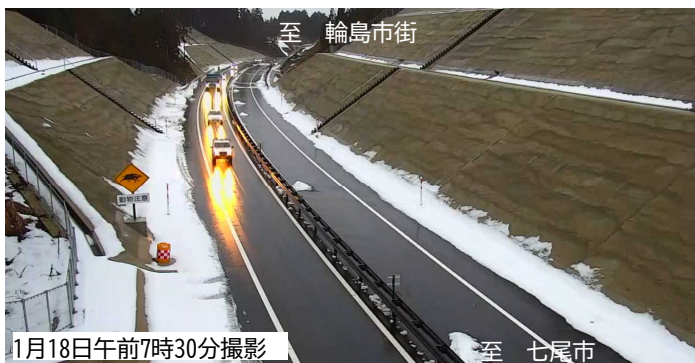
■写真① 輪島市三井町小泉高架橋付近