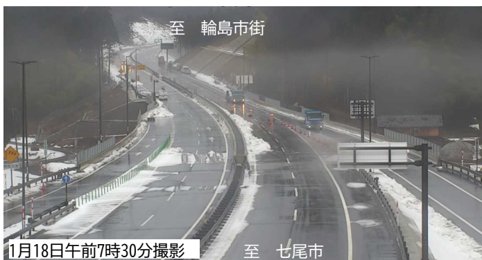
■写真② 輪島市三井町のと里山空港IC付近