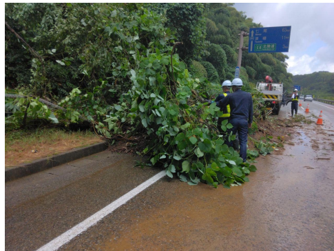
◆R7.8 低気圧と前線による大雨災害