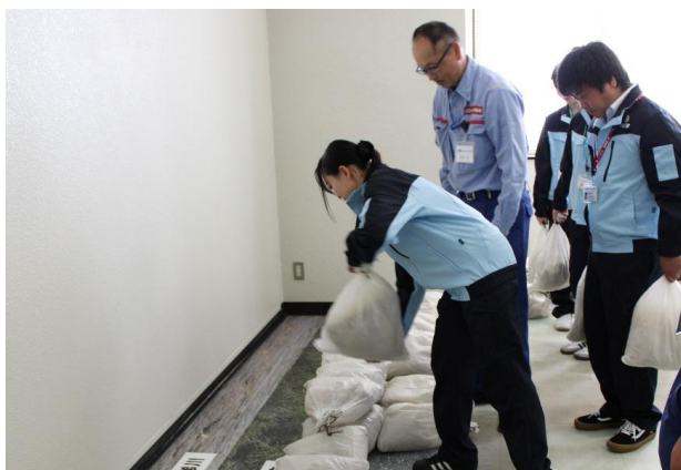
模擬土のうを使った水防活動体験