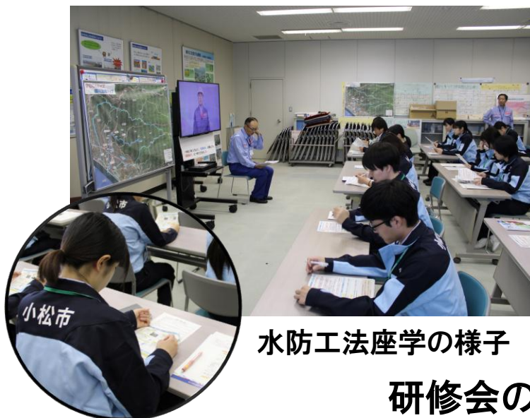
水防工法座学の様子