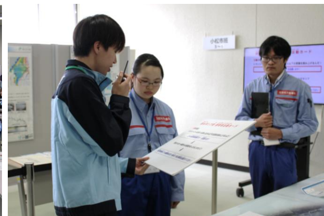
無線機を使った情報伝達体験