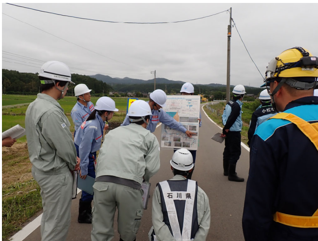
重要水防箇所の点検(梯川)