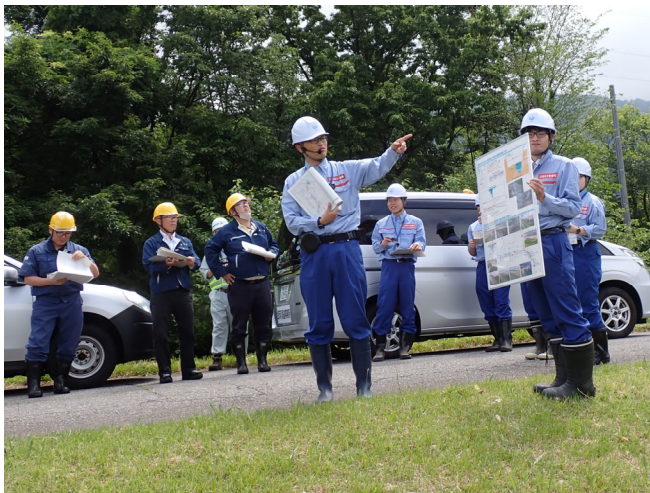
重要水防箇所の点検(手取川)