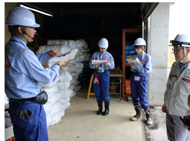
水防資材の点検(手取川)