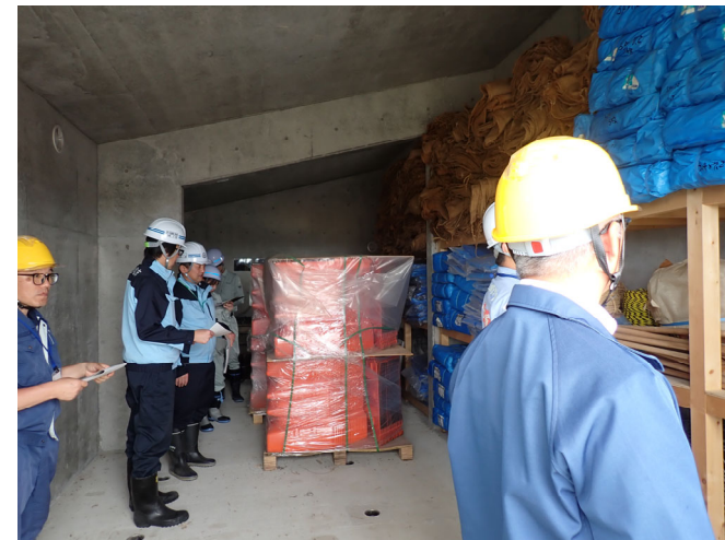
水防資材の点検(梯川)