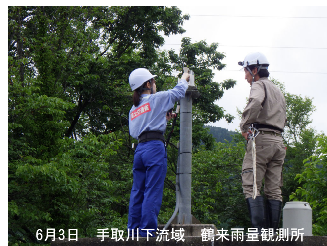
6月3日 手取川下流域 鶴来雨量観測所