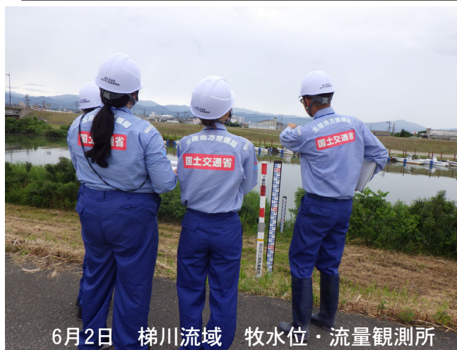
6月2日 梯川流域 牧水位・流量観測所