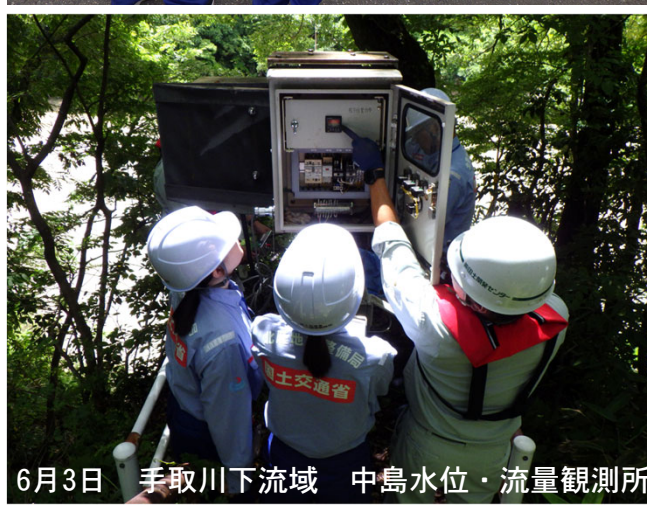
6月3日 手取川下流域 中島水位・流量観測所