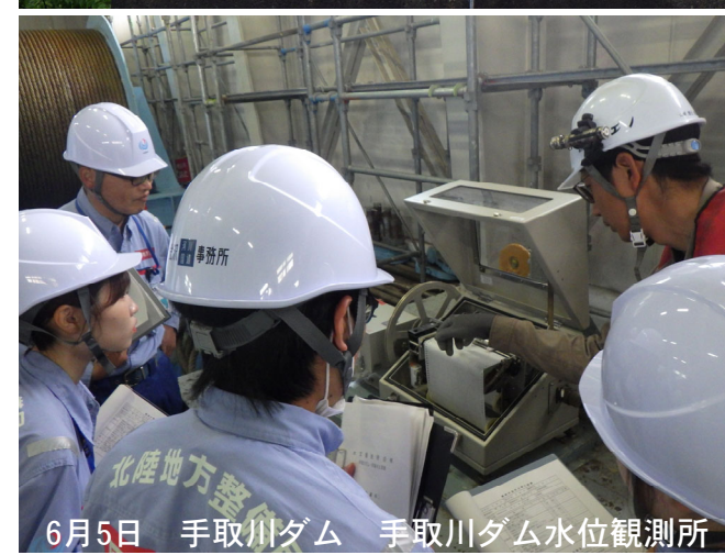
6月5日 手取川ダム 手取川ダム水位観測所