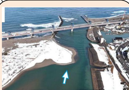
河口部土砂堆積状況 令和8年2月撮影