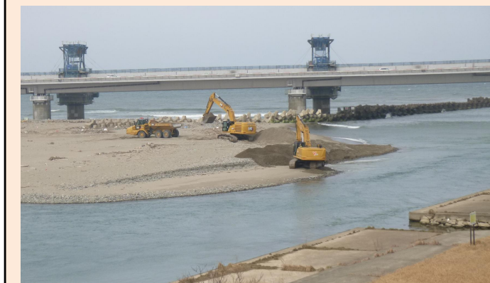
堆積土砂撤去作業状況(国) 令和8年3月撮影