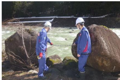
白峰砂防 白峰床固工