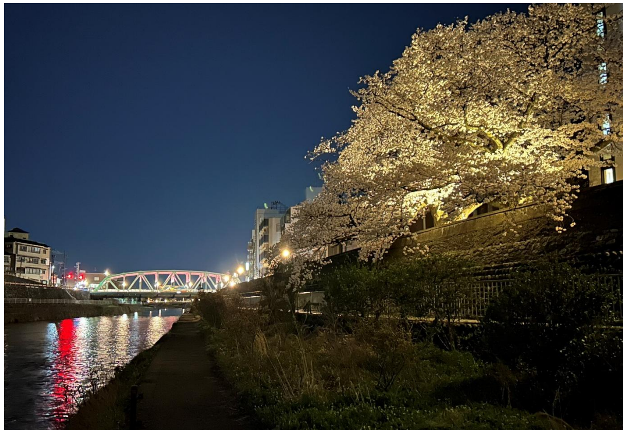
さいがわおおはし 犀川大橋と さいせい 犀星のみち桜並木ライトアップの様子