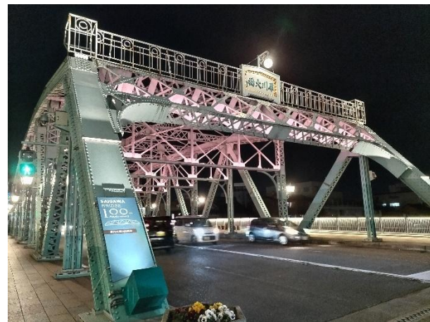
桜色ライトアップの様子