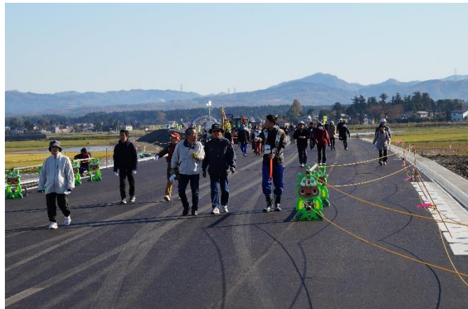
ウォーキングイメージ

金沢河川国道事務所では、能越自動車道 輪島道路(延長11.5km)の整備を進めており、そのうち、のさと三井IC(輪島市三井町本江)~のさと里山空港IC(洲衛)間(延長4.7km)は、令和5年9月16日(土)の開通を予定しております。