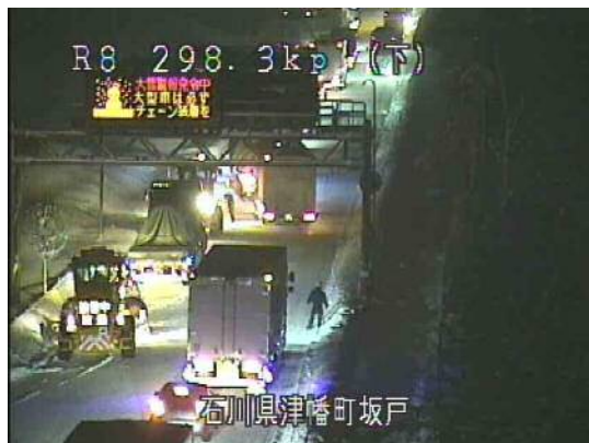
写真 立ち往生車両発生状況