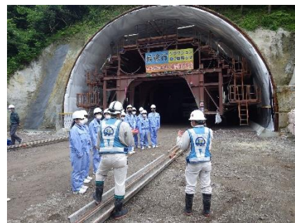
昨年の見学会の様子(トンネル工事現場)

※現場見学会会場には駐車場を用意しています。現場内では各自ヘルメットの用意・着用をお願いします。