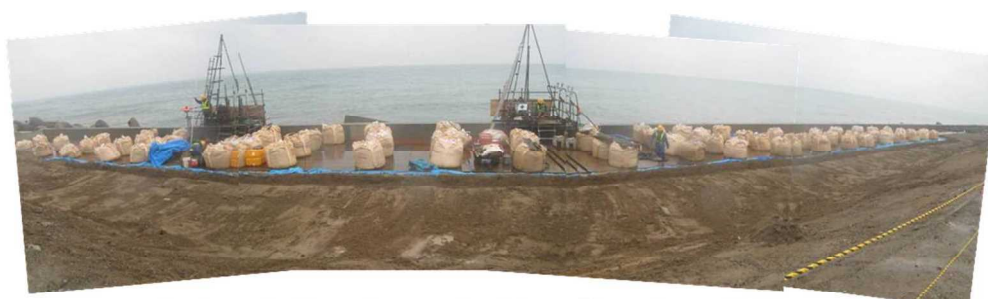
緊急復旧実施のイメージ（上記被災後の緊急復旧事例）