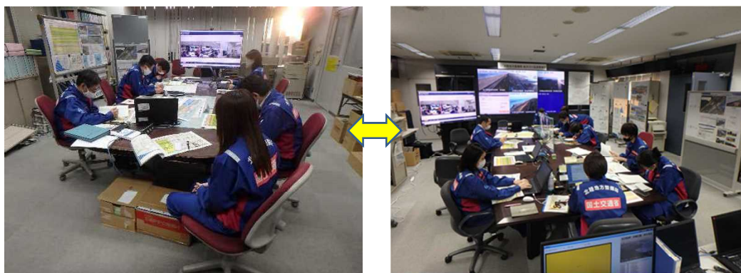
令和2年度演習時の様子（2つの会場をWeb会議形式により接続）