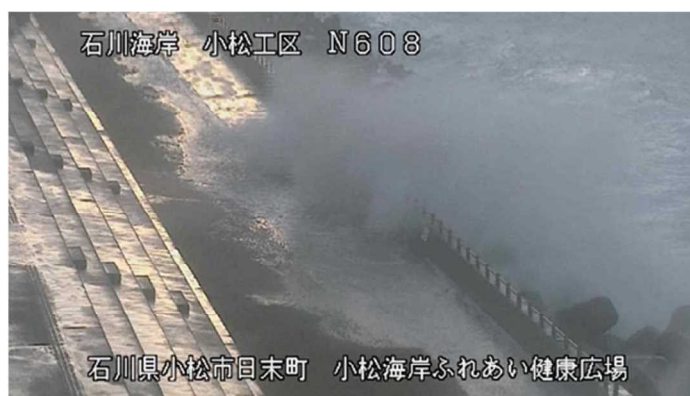
令和3年1月7日 16:10 冬季風浪の様子 （小松地区 CCTV カメラによる画像）