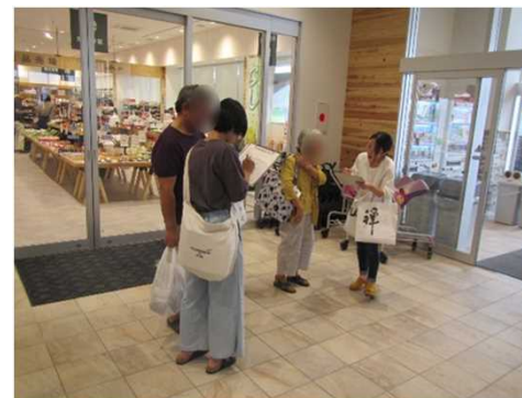
大学生が道の駅「めぐみ白山」の入り口で利用する方にアンケートを実施【昨年】

白山市が「SDGs未来都市」に選定されていることやSDGsの認知度をアンケート調査し、あわせてSDGsの情報発信を図る。