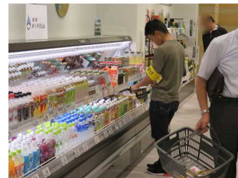
大学生が道の駅「めぐみ白山」で商品内容・展示方法等の現状調査【昨年】