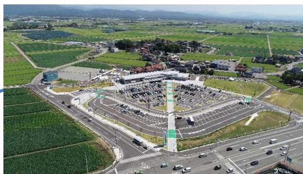
道の駅「めぐみ白山」