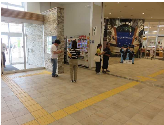
来客者調査の様子