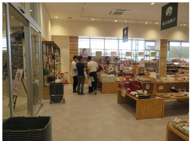
商品内容調査の様子