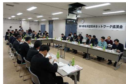
【前回の協議会の様子】