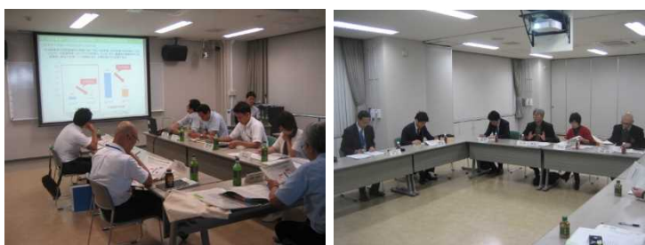
【本年度の研究会の様子】

協議会の下部組織として発足し、平成30年7月に第1回を開催。これまでの10年間における自転車関連事故の発生状況を分析し、現地調査を踏まえ事故対策方針を検討。歩行者・自転車・クルマが安全に通行できる道路空間の創出に向けた研究を行っている。