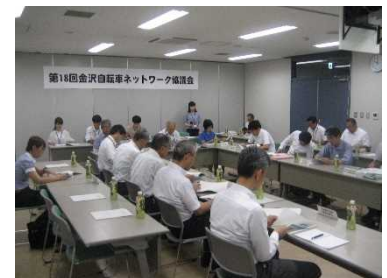
【前回の協議会の様子】