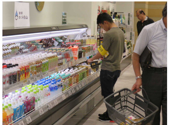
商品内容調査の様子