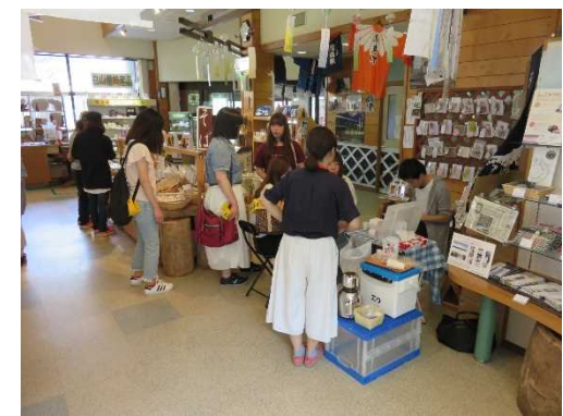
大学生が道の駅「瀬女」で商品内容・展示方法等の現状調査と改良の提案【昨年】