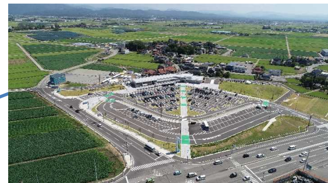
道の駅「めぐみ白山」

※1 持続可能な開発目標(SDGs) SDGs: Sustainable Development Goals 2015年9月の国連サミットで採択されたもので、国連加盟193ヶ国が2016年～2030年の15年間で達成するために掲げた目標です。17の目標と、それらを達成するための具体的な169のターゲットで構成されています。