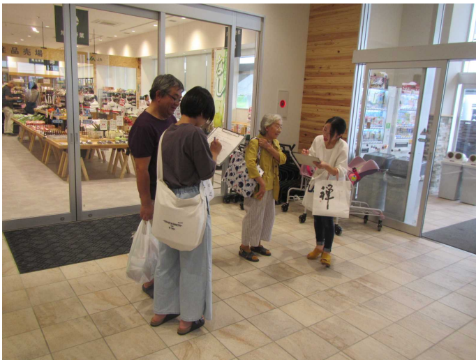
来客者調査の様子