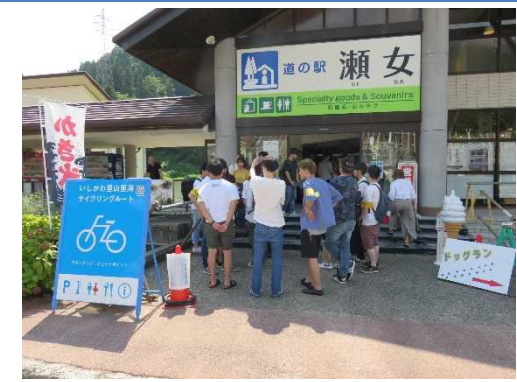
大学生が道の駅「瀬女」の入り口で利用する方にアンケートを実施【昨年】