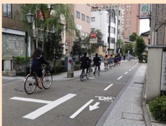
●自転車走行指導帯の設置(せせらぎ通り)