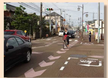
●自転車走行指導帯の設置(県道窪野々市線)