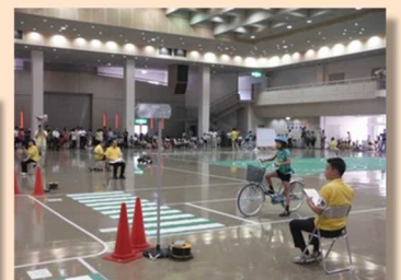
●子ども自転車大会