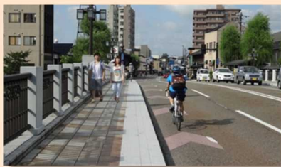
●自転車走行指導帯の設置(国道159号)