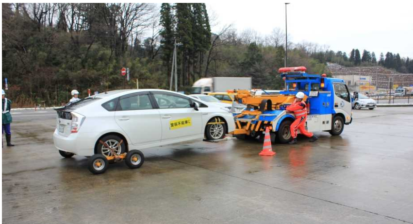
自動車連盟(JAF)石川支社による 車両移動のデモンストレーション