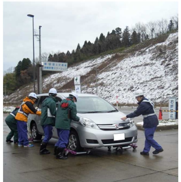
車両移動装置を用いての 職員による放置車両移動