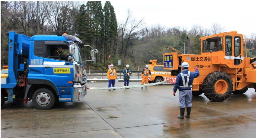
除雪車の牽引による大型車移動