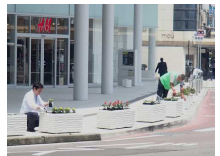
平成28年度の花植の様子 (国道157号金沢市片町にて)