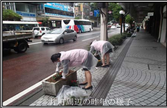
片町周辺の昨年の様子