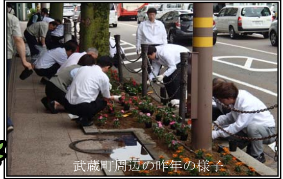
武蔵町周辺の昨年の様子