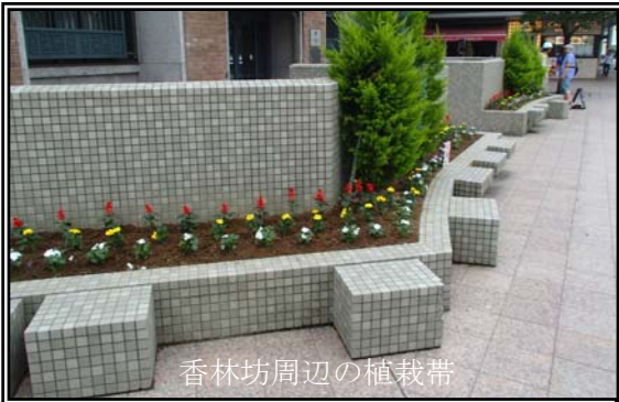
香林坊周辺の植栽帯