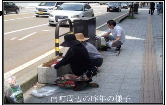
南町周辺の昨年の様子