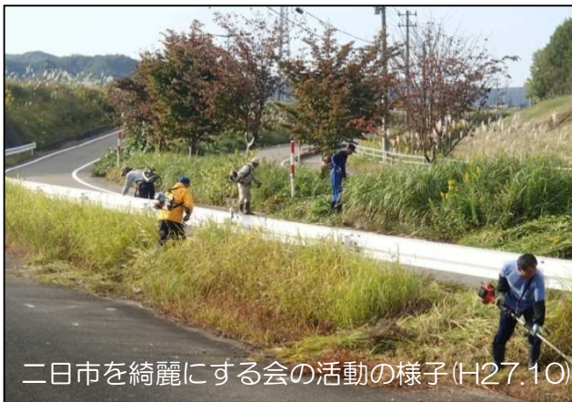
二日市を綺麗にする会の活動の様子(H27.10)