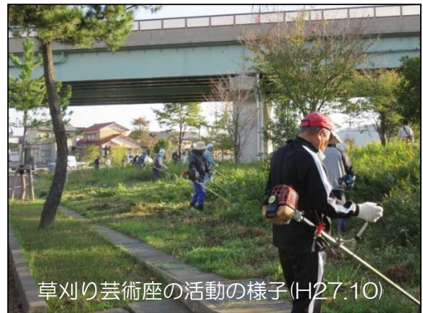
草刈り芸術座の活動の様子(H27.10)