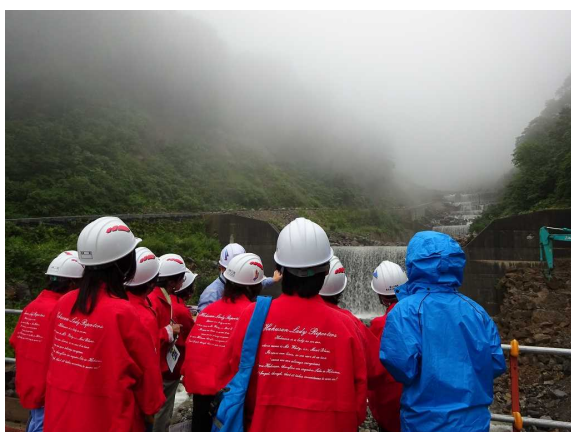
白山砂防事業現場見学