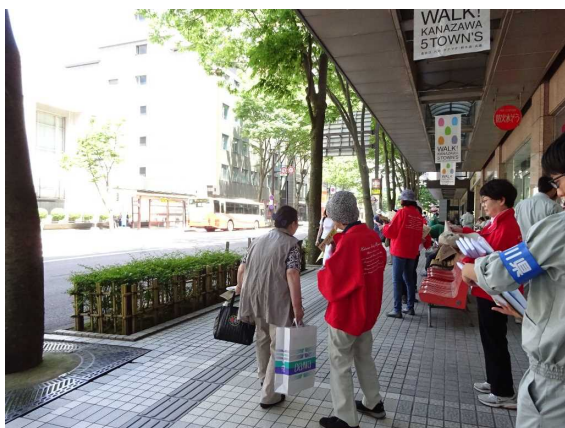
土砂災害防止月間広報キャラバン