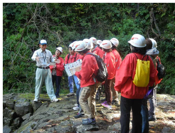
福井県アカタン砂防堰堤群見学(他地域の事業見学)