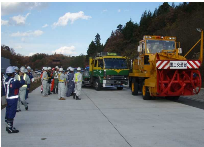
除雪車による大型車移動