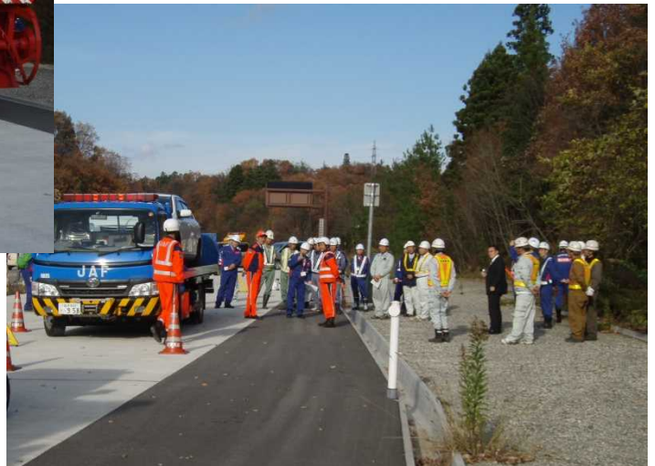
(一社)自動車連盟石川支社による デモンストレーション