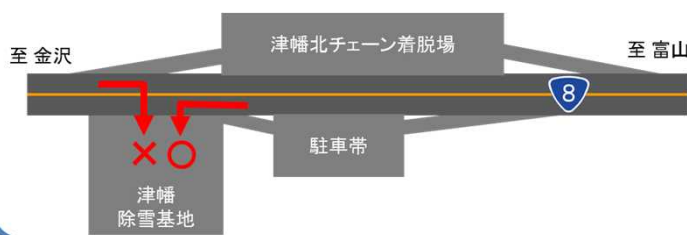
【倉見出口付近詳細図】