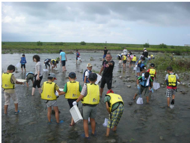
水生生物を採取しているところ（手取川）