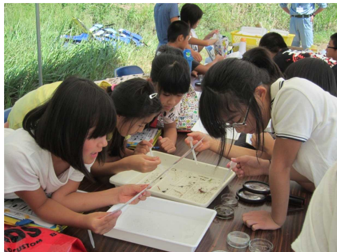
水生生物を分類しているところ（梯川）