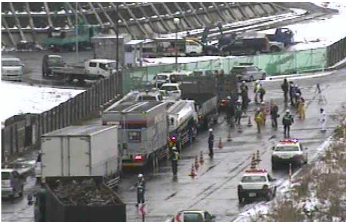
(車両引き込み状況)