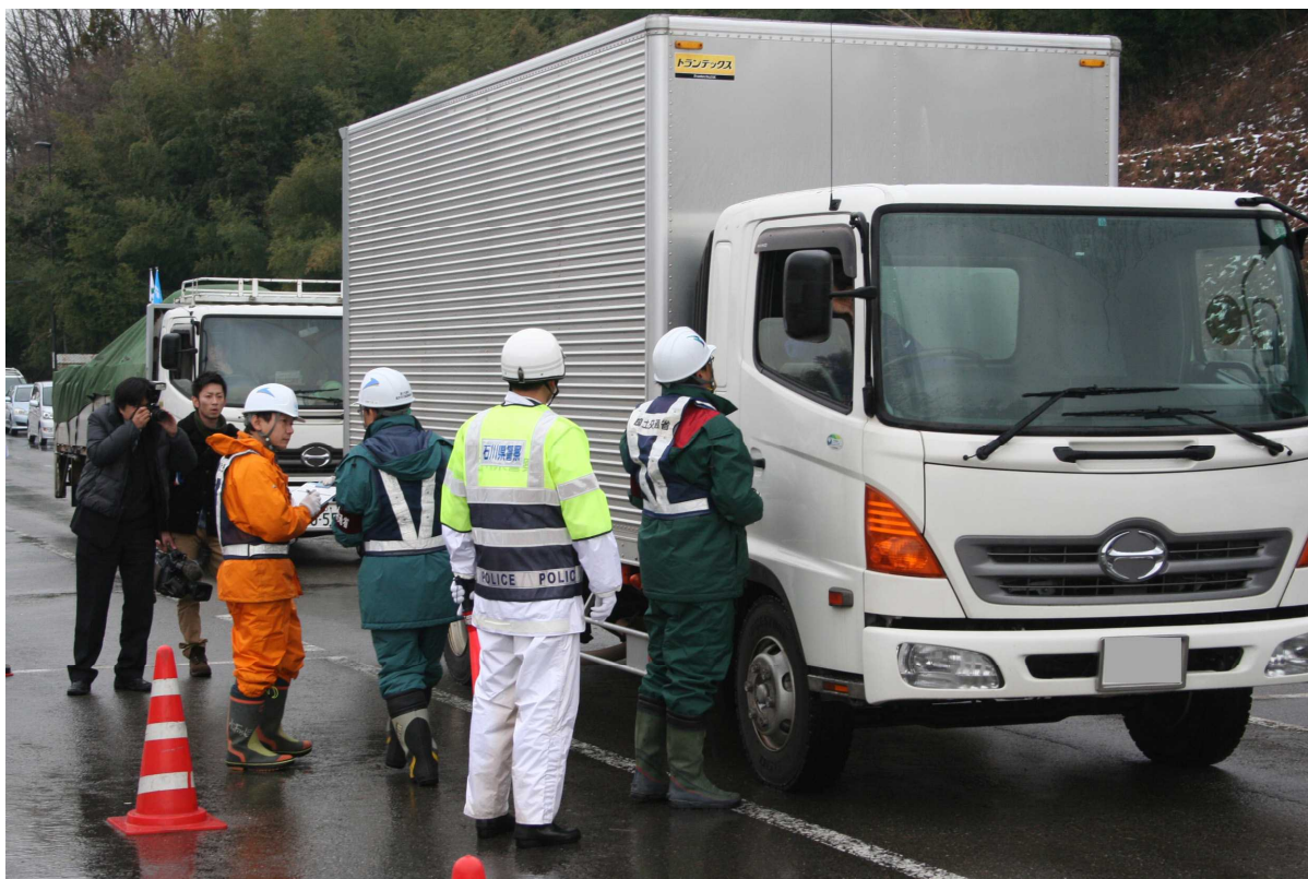
(注意喚起・タイヤチェック状況)