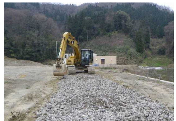
ふれあい体験で見学する建設機械

※取材を希望される方は、現場への進入制限がありますので事前に問い合わせ先までお申し込み下さい。